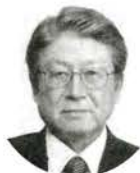
松尾福利厚生部会長